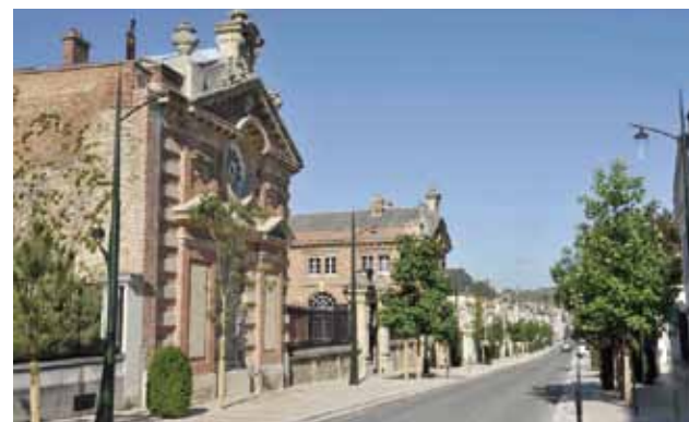
Ancien cellier Piper