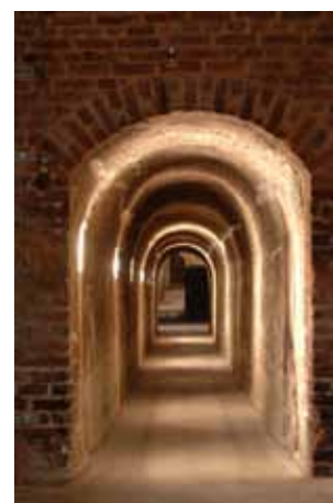
Caves Pol Roger