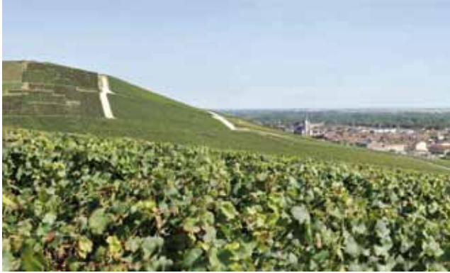
Coteaux historiques - Aÿ

L'invention du vin de Champagne, à l'aube de la révolution industrielle, et sa transformation, d'un produit artisanal en une production de masse, tout en s'appliquant à préserver l'excellence du produit, a nécessité une élaboration et une commercialisation intégrant des processus industriels et capitalistiques. Cette évolution a fortement marqué l'aménagement du territoire champenois et l'organisation interprofessionnelle et sociale. Elle a créé un paysage rural et urbain spécifique de type agro-industriel.