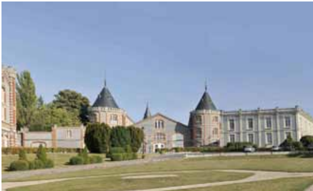
Domaine Pommery - Reims

L'invention du vin de Champagne, à l'aube de la révolution industrielle, et sa transformation, d'un produit artisanal en une production de masse, tout en s'appliquant à préserver l'excellence du produit, a nécessité une élaboration et une commercialisation intégrant des processus industriels et capitalistiques. Cette évolution a fortement marqué l'aménagement du territoire champenois et l'organisation interprofessionnelle et sociale. Elle a créé un paysage rural et urbain spécifique de type agro-industriel.