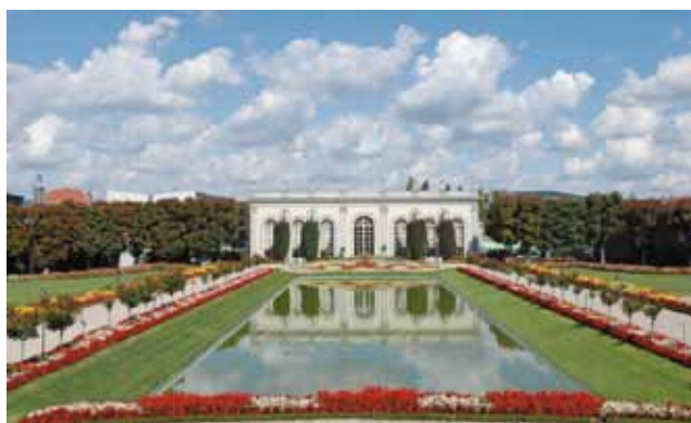
Orangerie Moët et Chandon