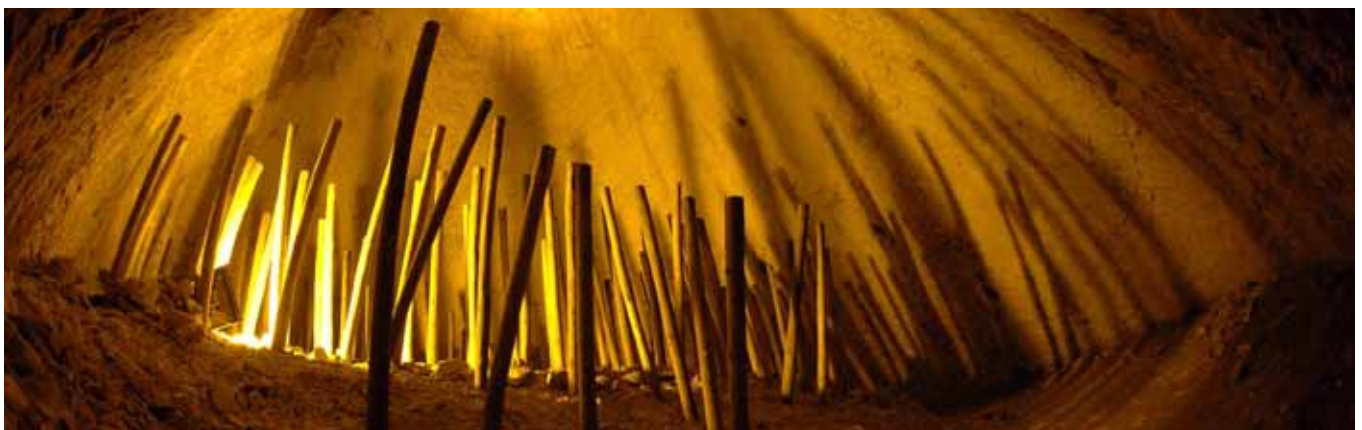
Crayère Martel - Reims