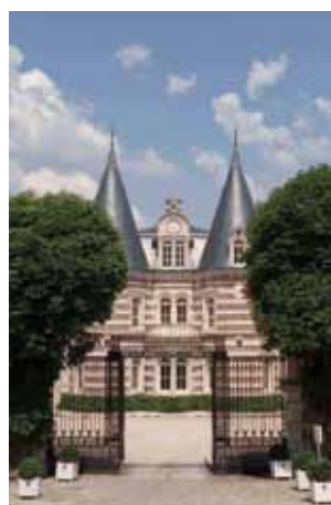
Château de Pékin