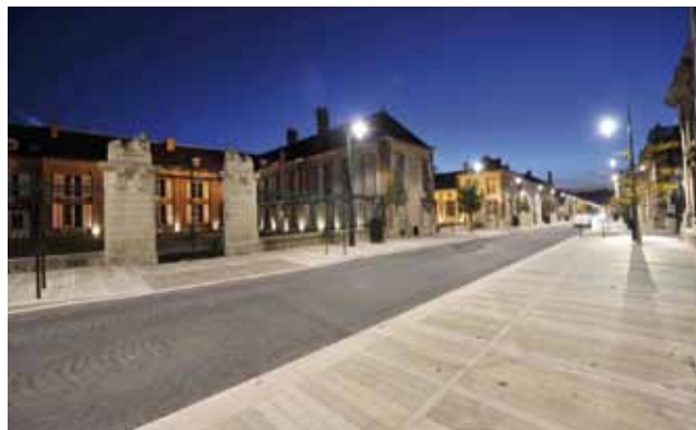
Avenue de Champagne

La « voie royale du Champagne » est un des exemples les plus achevés de création ex nihilo d'un cadre de production autant aérien que souterrain. En effet, elle regroupe vignes, bâtiments industriels, caves, bâtiments d'accueil et de prestige. Son histoire raconte celle de la naissance, de l'essor et de l'actualité des Maisons de Champagne, tant pour le développement des outils de production, des infrastructures de communication (vers Paris, puis les capitales européennes avant le monde entier) que des immeubles de représentation.