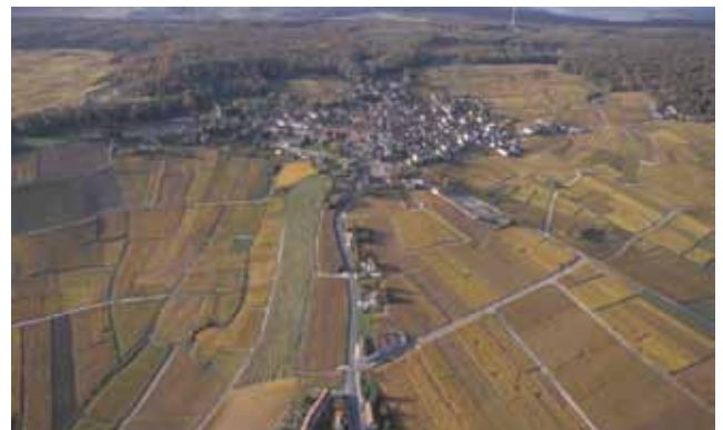
Coteaux historiques - Hautvillers

Enfin, ce site présente des caractéristiques spécifiques au vignoble champenois : omniprésence de la craie, disposition et configuration des villages, étagement ordonné de l'occupation du sol, monoculture.