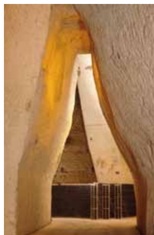
Crayère Charles Heidsieck

Le patrimoine souterrain présente une ampleur sans précédent (plus de 1 000 puits d'extraction et plus d'un million de m 3 de craie extraite). Il constitue aujourd'hui la part prépondérante du patrimoine industriel de la cité. De nos jours, des dizaines de millions de bouteilles sont stockées dans le sous-sol crayeux de cette partie de la ville, à une fraîcheur et une humidité constantes, permettant ainsi aux vins de Champagne une maturation incomparable.