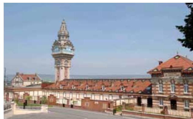
Maison de Castellane