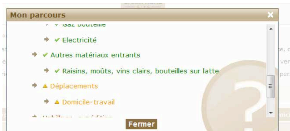
Figure 3. Le lien "Mon parcours" vous permet de voir où vous en êtes dans la saisie et de naviguer rapidement entre les différentes pages.

Ce lien peut aussi vous permettre de naviguer rapidement sur l'ensemble des pages si vous désirez modifier une donnée. Le lien "Ac-