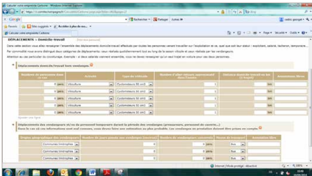
Figure 2. Vue sur la page de saisie des déplacements domicile/travail.