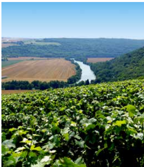
Vues caractéristiques du vignoble d'Azy-sur-Marne et de Bonneil (Aisne).