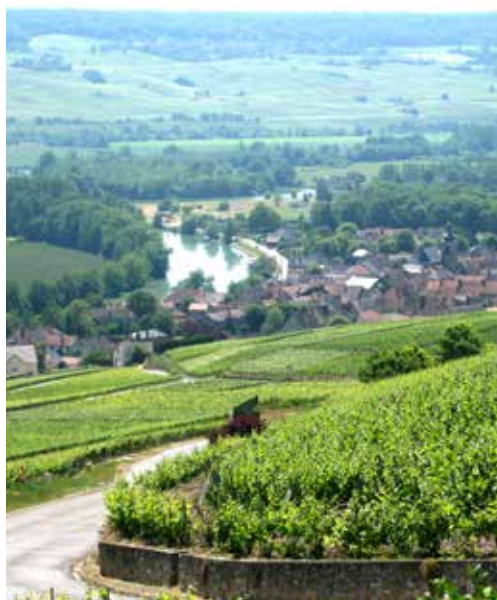
Vues caractéristiques du vignoble des coteaux historiques (Marne).