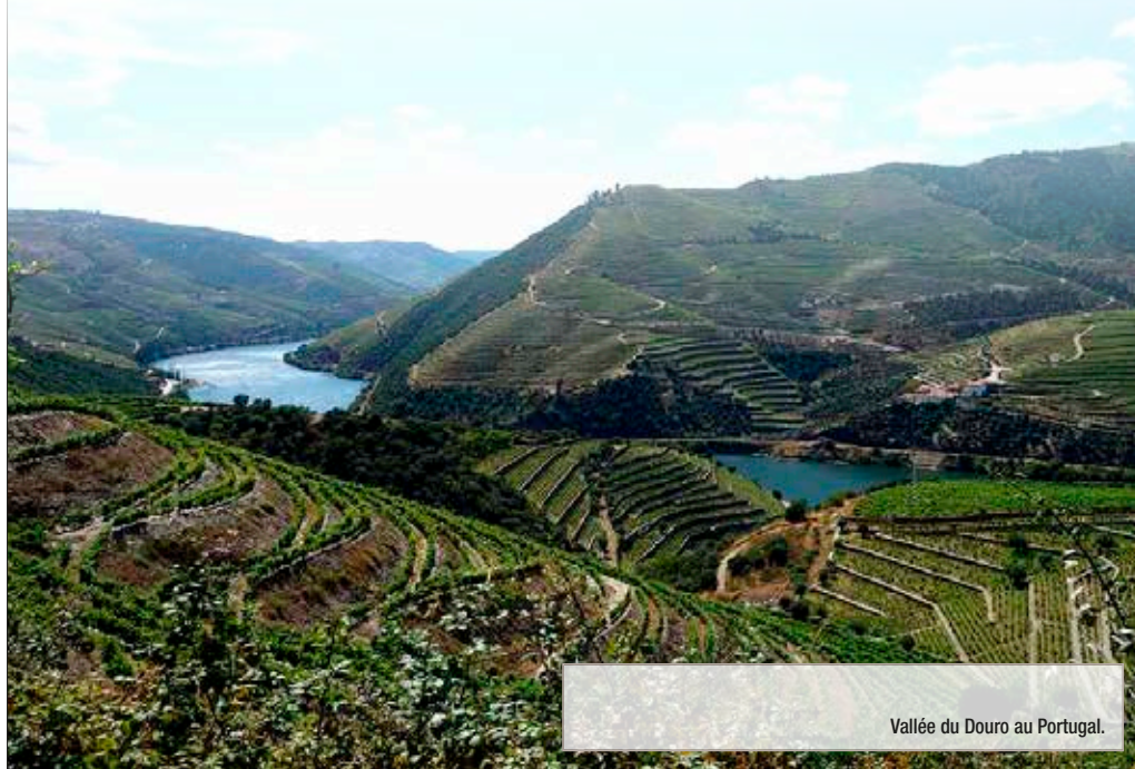
Vallée du Douro au Portugal.

L'ensemble "Coteaux, Maisons et Caves de Champagne" témoigne, par l'organisation de ses sites, de la montée en puissance à l'ère industrielle d'un mode de production original qui a imprimé le paysage et donné naissance à un vin mondialement reconnu. Les Coteaux, Maisons et Caves de Champagne sont en effet les espaces de la naissance, de la production et de la diffusion commerciale mondiale d'un vin devenu le modèle des vins effervescents et une référence universelle de la