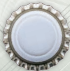
Joints moulés 29 et 26 mm