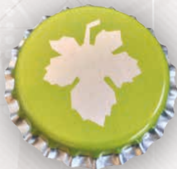
Joints à disques 29 et 26 mm