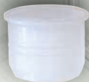
Obturateurs 29 mm