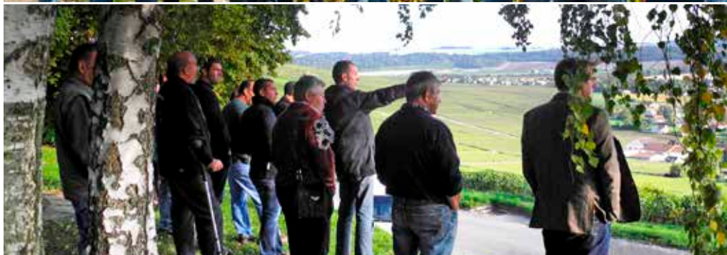
Sorties terrain réalisées aux Riceys et à Azy/Bonneil en octobre 2013.

En parallèle, les animations sur le terrain ont déjà commencé, notamment durant l'été 2012.